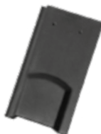
vetracia (vetrací prierez 25 cm 2 )