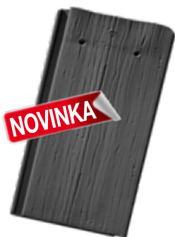
základná škridla (štrukt. povrch)